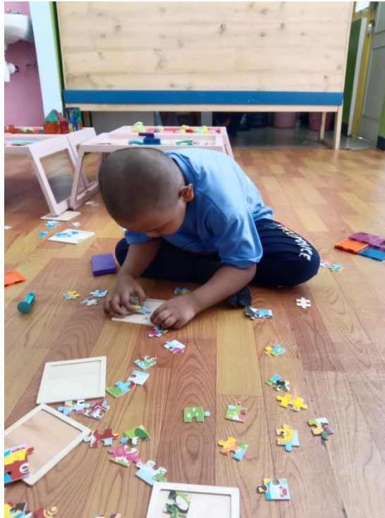
Gambar 2. Ini adalah contoh aktivitas motorik halus yaitu menyusun puzzle yang terdiri dari bagian bagian yang kecil.