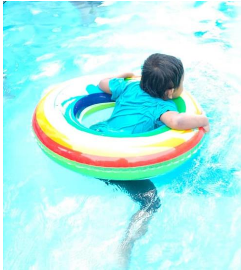
Gambar 1. Ini adalah contoh kegiatan untuk melatih motorik kasar yaitu berenang