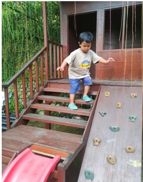
Gambar 2. Ini adalah contoh gerakan lokomotor yaitu naik turun tangga yang merupakan keterampilan motorik kasar