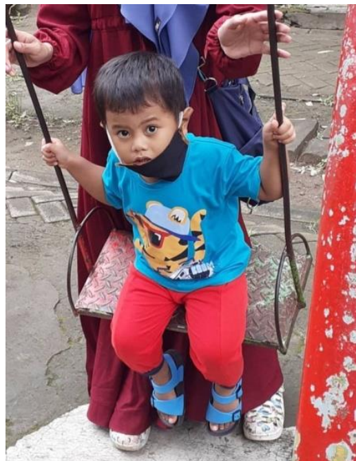
Gambar 4. Ini adalah contoh kegiatan untuk melatih keseimbangan yang merupakan bagian dari latihan untuk motorik kasar yaitu dengan bermain ayunan