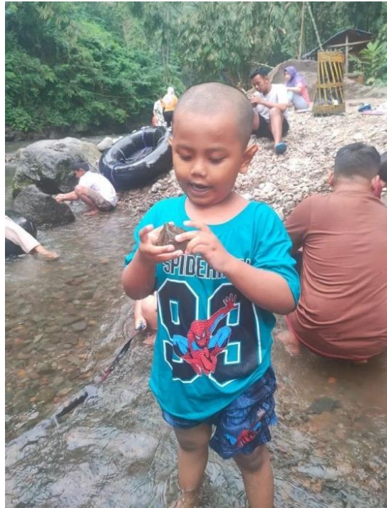
Gambar 3. Ini adalah contoh kegiatan di alam yaitu bermain di sungai yang bagus untuk melatih motorik kasar.